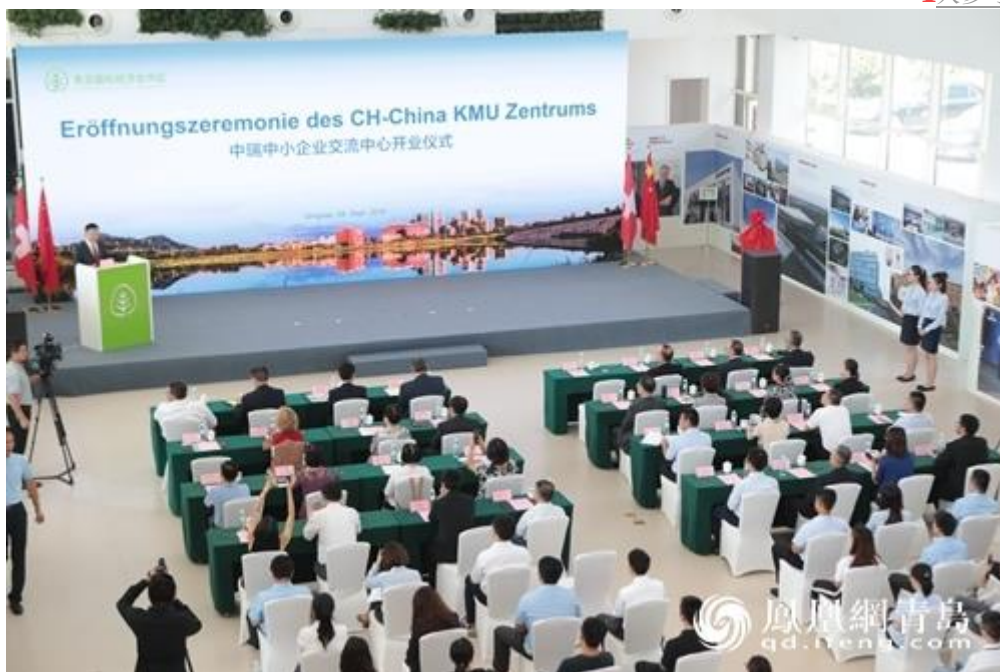
中瑞中小企业交流中心开业仪式

9月4日，“中瑞中小企业交流中心”开业仪式在青岛国际经济合作区举行，这是继北京、上海、天津、广州、深圳后，在中国设立的第六个中瑞中心。